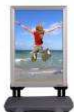
Werbung bei Wind und Wetter